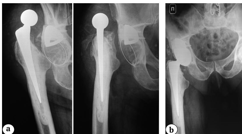
Рис. 2. Рентгенограммы правого тазобедренного сустава при повторной госпитализации:

Со дня повторной госпитализации пациент переведен на парентеральную антибактериальную