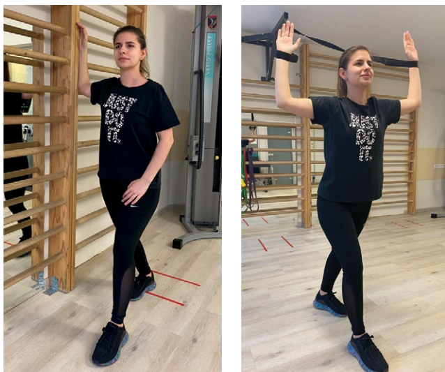
Рис. 4. Растяжка малой грудной мышцы в положении 90/90 стоя у стены или в петлях TRX

Fig. 4. Stretching of the pectoralis minor muscle in the 90/90 position standing against a wall or in TRX loops