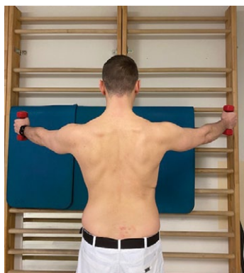
Рис. 2. Тест на дискинезию лопатки по McClure