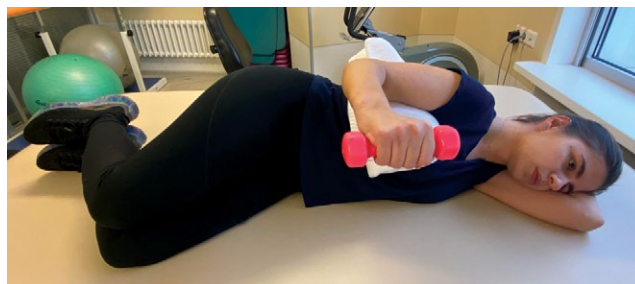
Fig. 5. Sidelying external rotation