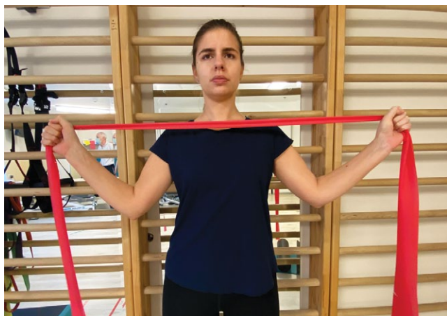
Рис. 7. Билатеральная наружная ротация в положении стоя при 0° отведения плеча с эспандером перед грудной клеткой для укрепления нижней порции трапециевидной мышцы и подостной мышцы (W-exercise)

Fig. 7. Bilateral external rotation in a standing position at 0° shoulder abduction with an expander in front of the chest to strengthen the lower portion of the trapezius muscle and the infraspinatus muscle (W-exercise)