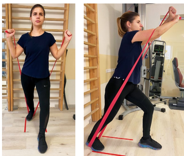
Рис. 8. Динамические обнимания с резиновым эспандером

M.J. Decker с соавторами сравнили несколько групп упражнений для выявления максимально направленных на увеличение силы передней зубчатой мышцы. При электромиографии они обнаружили наибольшую активность мышцы при выполнении вышеупомянутого упражнения «отжимания плюс», или push-up plus, а также при «динамических обниманиях» (dynamic hugs) [37] (рис. 8).