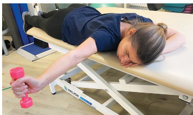
Рис. 6. Горизонтальное отведение в сочетании с наружной ротацией с утяжелением

Fig. 6. Horizontal abduction in combination with external rotation and weighting