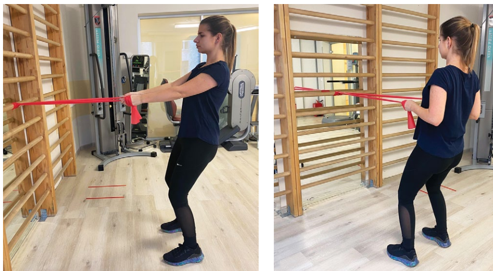
Рис. 9. Упражнение тяги на ромбовидные мышцы с резиновым эспандером Fig. 9. Low-row exercise on rhomboid muscles with a rubber expander

ходимостью повторений от 10 до 20 раз, по 3 подхода при удержании сведения лопаток по 3 сек. [38] (рис. 9).