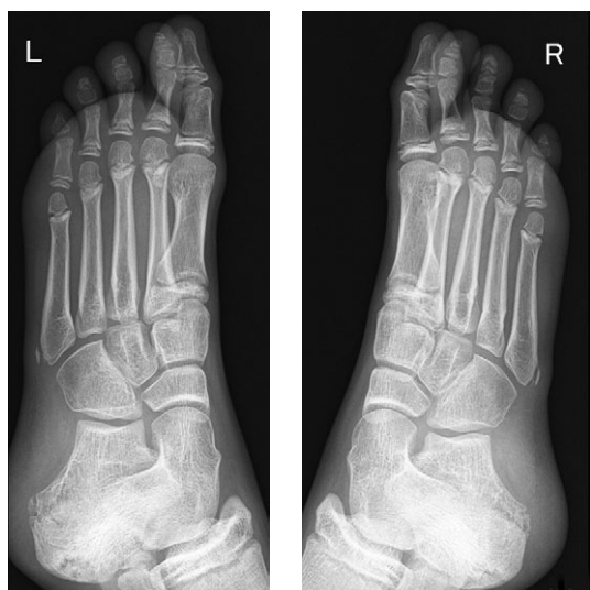
Рис. 4. Пример невромы Изелина (двухсторонний тракционный апофизит основания пятой плюсневой кости) у профессиональной гимнастки 11 лет

Неврома четвертого межплюсневых промежутка получила свое название в честь Изелина (Iselin), ортопеда, описавшего в 1912 г. тракционный апофизит основания пятой плюсневой кости у подростков в момент появления вторичного очага окостенения основания пятой плюсневой кости (рис. 4). Для данного заболевания характерна боль в области внешнего края средней части стопы, которая усиливается при повышенной физической нагрузке (бег, прыжки, танцы) [цит. по 23]. По мнению Э.Э. Ларсон (E.E. Larson) с соавторами, в дальнейшем имя хирурга стало ассоциироваться с невропатической болью в четвертом межпальцевом промежутке, что и привело к появлению термина «неврома Изелина» [6].