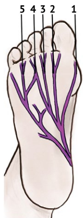
Рис. 1. Схема иннервации стопы и эпонимы невром подошвенных пальцевых нервов:

Цель обзора — определить корректность современной медицинской терминологии; выявить спектр эпонимов, неприемлемых для коммуникации со смежными специалистами и пациентами; восполнить исторический пробел и привлечь научную общественность к дискуссии на данную тему.