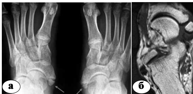
Рис. 3. Лучевая диагностика os tibiale externum : а – рентгенограмма; б – МРТ

Больного укладывают в положение на спине. На нижнюю треть бедра накладывається отдавливающий жгут. По наружной поверхности стопы