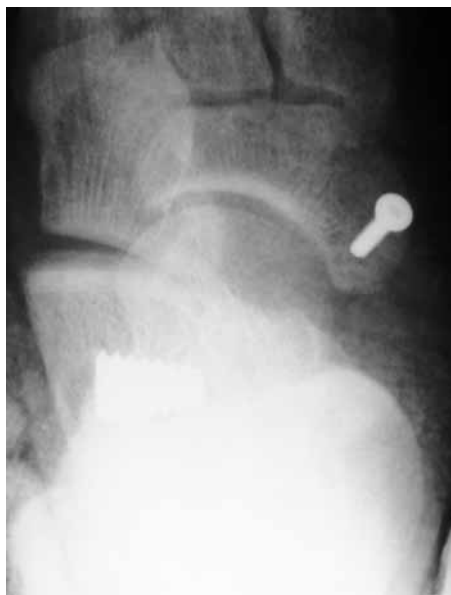
Рис. 9. Фиксация СДСП кортикальным винтом