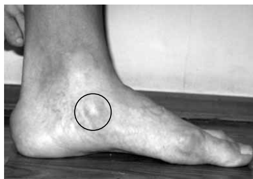
Рис. 1. Боковая поверхность стопы с os tibiale externum

Для определения степени плосковальгусной деформации, а также состояния сухожильно-связочного аппарата использовали следующие диагностические пробы: с подъемом на носки на одной ноге (рис. 2), симптом «подглядывающих» пальцев. Полученные результаты позволяют судить о состоянии СЗББМ.