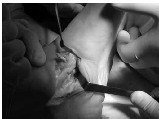
Рис. 8. Проведение СДСП через канал