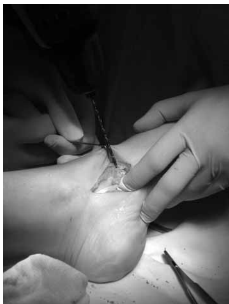
Рис. 7. Сверление канала в ладьевидной кости

на расстоянии 3–4 см от края швом по Краскову или Кюнео. После проведения под СЗББМ оно проводится через канал в ладьевидной кости с максимальным натяжением (рис. 8) Для этого стопу необходимо максимально супинировать. Проведение сухожилия не всегда удается выполнить сразу, поэтому нужно проверять соответствие диаметра канала. Далее выполняют подшивание дистального конца СДСП трансоссально к ладьевидной кости и тенодез с СЗББМ. Важным при этом является придание постоянного натяжения СДСП. В случаях, когда СДСП является коротким и не удается вывести его через канал или оно выводится под самый край, можно для фиксации использовать обычный кортикальный винт диаметром от 4,0 мм (рис. 9). Использование спонгиозных винтов может травмировать сухожилие.