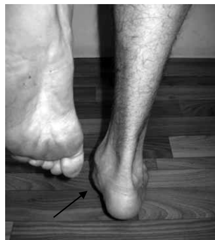
Рис. 2. Проба с подъемом на носки на одной ноге