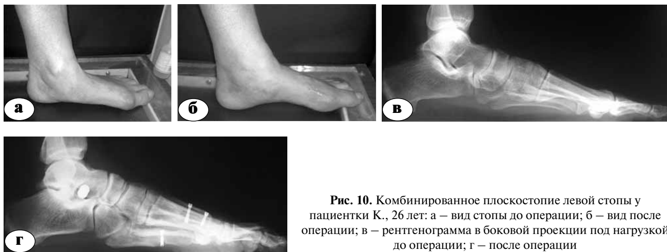
Рис. 10. Комбинированное плоскостопие левой стопы у пациентки К., 26 лет: а – вид стопы до операции; б – вид после операции; в – рентгенограмма в боковой проекции под нагрузкой до операции; г – после операции

Несмотря на малый размер выборки и относительно короткий период наблюдения, более углубленный анализ данных, полученных при обследовании больных, позволяет высказать некоторые соображения. Не выявлено связи между максимальным увеличением баллов по AOFAS и наибольшей коррекцией по рентгенограммам. Это расхождение клинических и рентгенографических данных позволяет предполагать, что не так важно установить нормальные углы на рентгенограмме для получения наилучшего результата для больного. У таких пациентов удаление добавочной кости почти не влияет на изменение оси стопы, что подтверждает важность блокирования смещение таранной кости относительно пяточной.