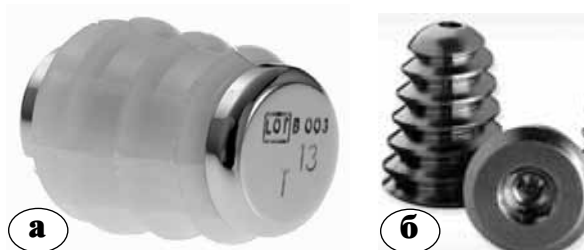
Рис. 4. Эндортезы с самоблокирующим краем: а – Kalix®II; б – Vilex

производится продольный разрез чуть впереди от латеральной лодыжки над sinus tarsi . Через sinus tarsi вводится рычаг или развертка под шейку таранной кости. После подбора размера проводят имплантат с помощью направителя или импактора. В результате головка таранной кости приподнимается, устранив пронацию пятки.