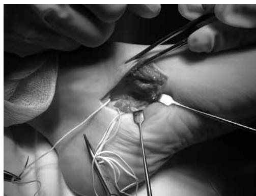
Рис. 6. Образованное ложе после удаления os tibiale externum