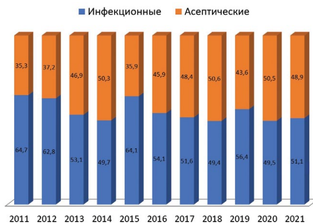
Рис. 1. Структура основных причин ревизионного эндопротезирования коленного сустава в НМИЦ ТО им. Р.Р. Вредена с 2011 по 2021 г. включительно

При анализе регистра эндопротезирования коленного сустава НМИЦ ТО им. Р.Р. Вредена с 2011 по 2021 г. включительно отмечается тенденция выравнивания процентного соотношения асептических и септических ревизий (рис. 1). Это, вероятно, связано с кривой обучения и вытекающим из этого постепенным уменьшением количества рисков, а именно интраоперационной кровопотери и времени первичного оперативного вмешательства. Однако эти данные сложно экстраполировать на другие клиники, поскольку в данном случае НМИЦ ТО им. Р.Р. Вредена выступает в роли ревизионного центра, куда направляется большая часть профильных пациентов со всех регионов Российской Федерации независимо от места выполнения первичной артропластики.