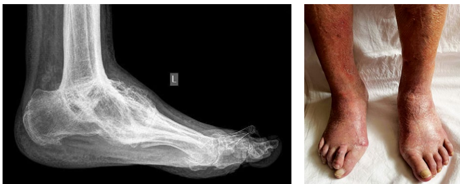
Рис. 4. Рентгенограмма и фото стоп и голеностопных суставов через 1,5 года после демонтажа АВФ