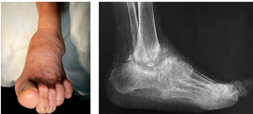
Рис. 2. Фото и рентгенограмма стопы и голеностопного сустава перед началом стационарного лечения

После демонтажа аппарата реабилитацию и постепенную дозированную нагрузку на конечность осуществляли в иммобилизирующем голеностопном ортезе с пневмокамерой в течение 10 мес. В дальнейшем был выполнен переход на индивидуальную ортопедическую обувь с перекатной подошвой. Результат лечения через 1,5 года представлен на рисунке 4.