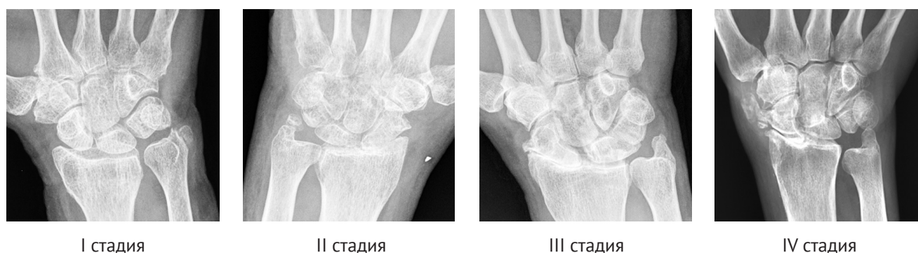
Рис. 1. Фрагменты рентгенограмм кисти пациентов с разными стадиями SLAC в прямой проекции

IV стадия — дегенеративный артроз полулунно-лучевого сустава.