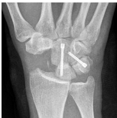
Рис. 3. Фрагмент рентгенограммы кисти пациента с III стадией SLAC в первые сутки после четырехугольного артродеза с иссечением ладьевидной кости

Четырехугольный артродез — это резекция ладьевидной кости в сочетании со сращением полулунной, головчатой, крючковатой и треугольной костей, этот способ лечения показан пациентам с III стадией артроза [4] (рис. 3).