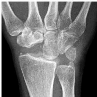
Рис. 2. Фрагмент рентгенограммы кисти пациента с II стадией SLAC в первые сутки после резекции проксимального ряда костей запястья

Модификации PRC. M.H. Ali с соавторами проанализировали отдаленные результаты PRC (минимальный срок наблюдения составил 15 лет,