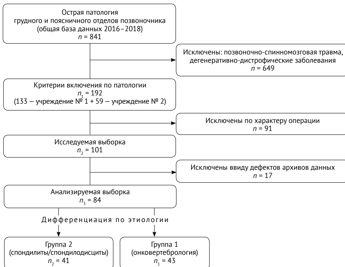
Рис. 1. Блок-схема отбора пациентов Fig. 1. Patient selection flowchart

Блок-схема отбора пациентов в исследование представлена на рисунке 1. Первичная выборка сформирована ретроспективно на основе двухцентровой когорты пациентов в возрасте 18 лет и старше с острой патологией грудного и поясничного отделов позвоночника, получавших лечение по поводу неотложных состояний в отделениях травматологии и ортопедии, нейрохирур-