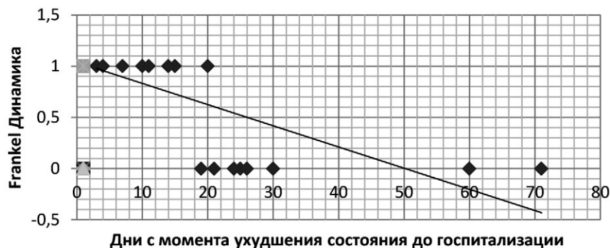
Рис. 4. Диаграмма разброса для анализируемых факторов группы 2