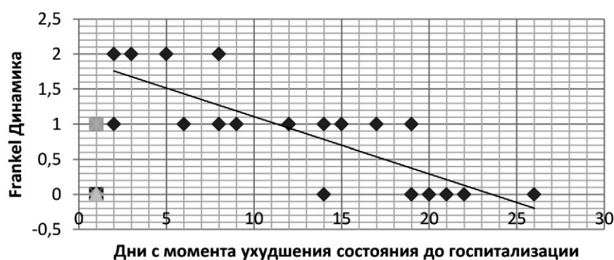
Рис. 3. Диаграмма разброса для анализируемых факторов группы 1